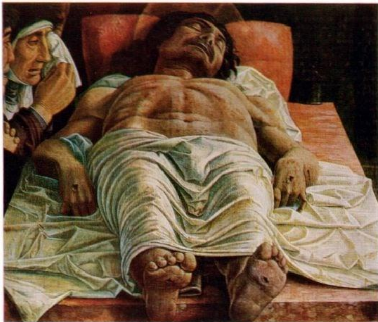
(Andrea Mantegna. Lamentação sobre o Cristo morto, 1480. Pinacoteca de Brera, Milão.)

5- (Unesp 2017) A pintura representa no martírio de Cristo os seguintes princípios culturais do Renascimento italiano: